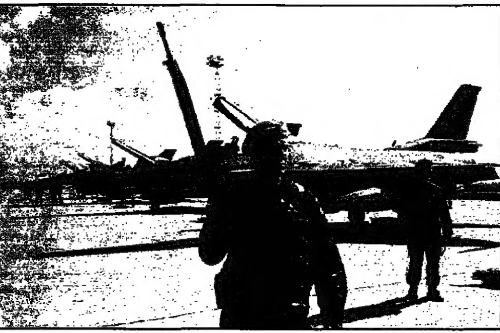
جنود قبرص الزائرين يمشون طائرات انا-16 تابعة لسلاح الجو التركي على موطها اس في مطار انكران بشمال قبرص للملاحة في مناورات جوية

■ هيراكليون (اليونان) - انقرة واسطنبول وكالاته وثق رئيس الوزراء اليوناني كوستاس سيميتيس والتركى مسعود يلماظ في ختام لقاء استمر تسعين دقيقة امس الاول الاثنين على استئناف عملية تطبيع العلاقات بين البلدين. ورأى سيميتيس في ختام اللقاء الذي عقد على هامش قمة دول البلقان في جزيرة كريت ان حصول اليونان في نظرهم التركي كانت مطروحة. اما يلماظ فقد تحدث عن حسن النية للتجاهل الذي ساد للقاء، وقال ماذا استمر تفكير اليوناني في موقفه فان هناك فرصا كبيرة لتقريب جدي بين البلدين. وفي لقاء منفصل مع الصحفيين، قال سيميتيس ان البلدين متفانان للبدء على مواصلة العلاقات بينهما في اطار الاتقان للواقع في مديريه في تروا (بوليا) للامني، وكذلك اليونان وتركيا في خريفه بموجب هذا الاتفاق. وأضاف سيميتيس الذي واثق على زيارة لقره في موعد لاحق انه يرحب بالصعوبات بيدينا فان الهدف الاساسي ما زال السلام والاستقرار والتعاون بين مختلفنا.